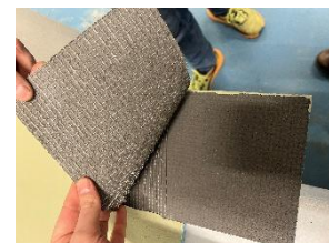
Bilde 2. Plate de laminerer før membran

Blå med grå kjerne Blå med grå kjerne Blå med grå kjerne Grå Blå Blå Blå